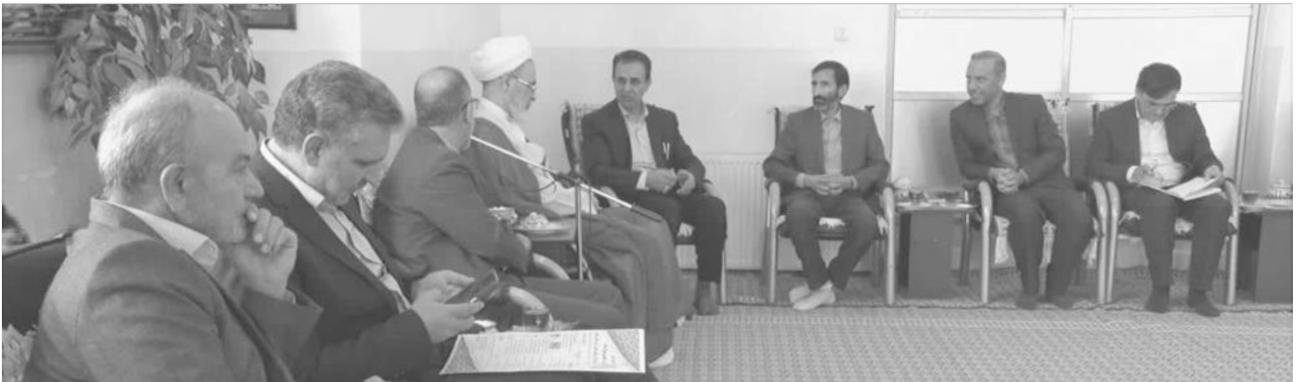
آیت... اعرافی در دیدار رئیس دانشگاه فنی حرفه‌ای استان یزد؛

آیت... اعرافی با قدردانی از همه کسانی که کارگزار وقف‌اند و در خدمت احیاء و ارتقا وقف تلاش می‌کنند و همچنین از واقفان و خیرین این عرصه گفت: رابطه انسان با مرگ از این دنیا قطع می‌شود اما کارهای ثواب و یا ناشایست که انسان پدید آورده است بعد از مرگ هم موجش باقی می‌ماند. مدیر حوزه‌های علمیه کشور افزود: یکی از چیزهایی که در این زمینه مهم است وقف است و کسانی که شاگرد و فرزند خوب تربیت می‌کنند و یا راه می‌سازند نتایج عمل و امواج آن بعد از مرگ باقی می‌ماند؛ بنابراین آدم‌های تیزبین به سراغ کارهایی می‌روند که موجش ماندگار است و پرونده انسان را پربارتر می‌کند که وقف در قله آن است. آیت... اعرافی بایان اینکه وقف معامله با خدا است گفت: بنابراین باید در احیاء