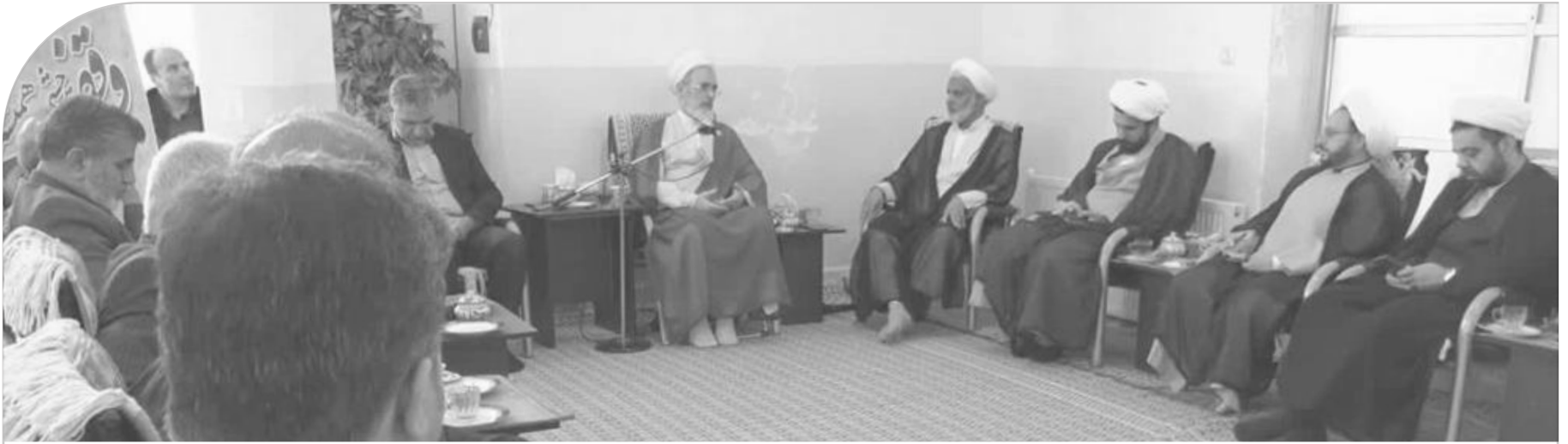
آیت... اعرافی در دیدار با مدیر کل و معاونین اداره اوقاف و امور خیریه استان یزد؛